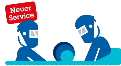
Schweißaufsichten | Schweißprüfungen Bedienerprüfungen