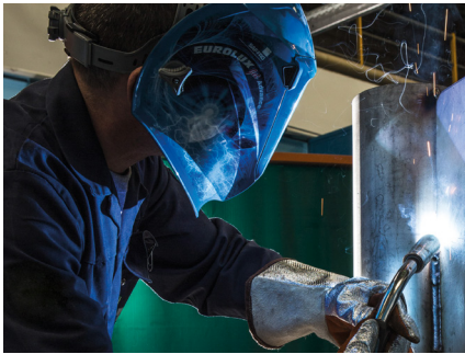
MAG-Schweißen hochlegierter Stähle

ARCAL™ Chrome ist die hochwertige Schutzgaslösung zum MAG-Schweißen hochlegierter Werkstoffe.