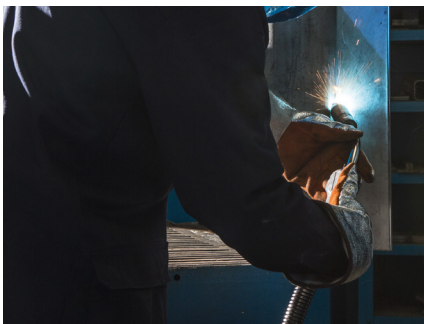
Für alle Schweißpositionen